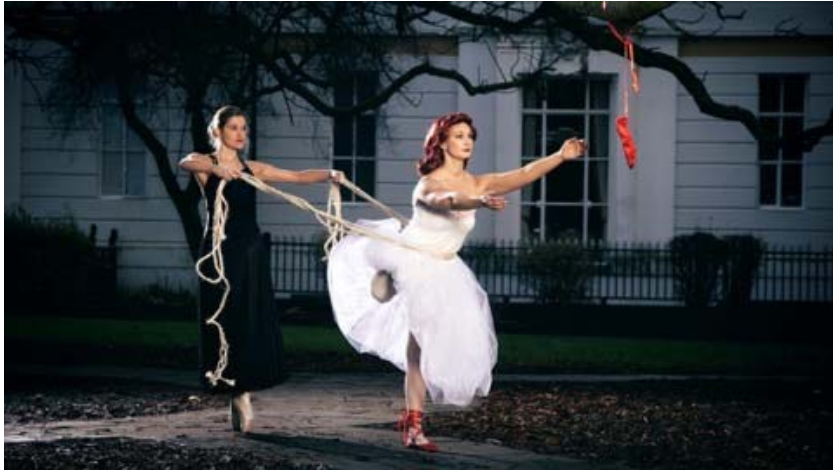
圖片 2 :《紅鞋》,11 Million Reasons 亞洲首展 | 英國文化協會主辦,香港,2016 | 照片由 People Dancing 委約,Sean Goldthorpe 拍攝