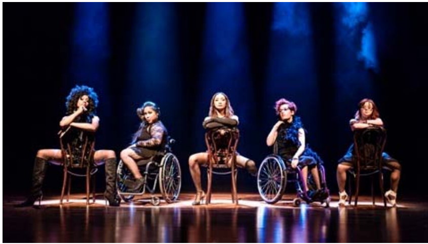
圖片 3:《芝加哥》,11 Million Reasons 亞洲首展 | 英國文化協會主辦,香港,2016 | 照片由 People Dancing 委約,Sean Goldthorpe 拍攝