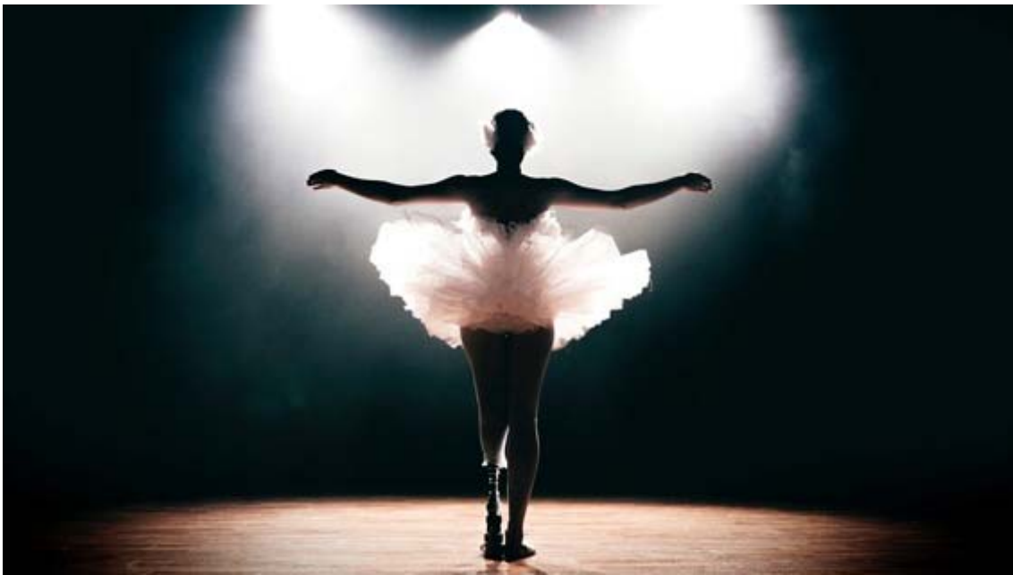
圖片 1: 《黑天鵝》, 11 Million Reasons 亞洲首展 | 英國文化協會主辦, 香港, 2016

#11Millionreasons #BritishCouncilHK #PeopleDancing #PopsyModernKitchen #InclusiveDance