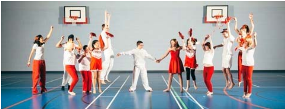
圖片 4:《歌舞青春》,11 Million Reasons 亞洲首展 | 英國文化協會主辦,香港,2016